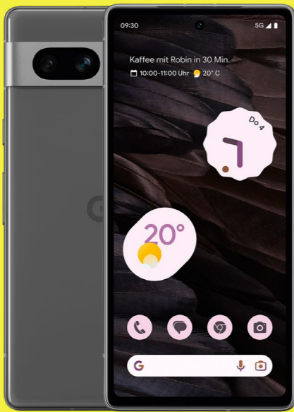
Google Pixel 7a 128 GB nur 1 €* Im Tarif congstar Allnet Flat L mit GB+ 21