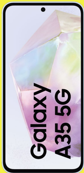
Samsung Galaxy A35 5G 128 GB nur 29 €* Im Tarif congstar Allnet Flat L mit GB+ 21