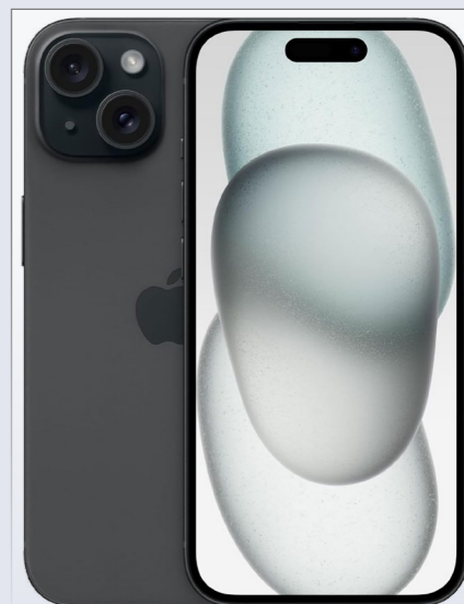
Apple iPhone 15 128 GB

Wir zahlen deine Reparaturkosten! WERTGARANTIE Komplettschutz ab 5,50 € mtl. → WERTGARANTIE ®